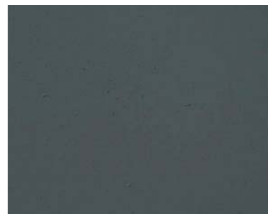
Decostotne fine bílý + břidlice 10