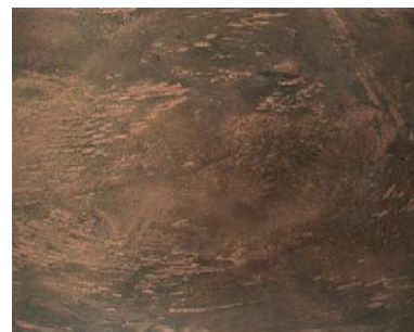
Decostotne beton šedá 1 s Mineral efektem Hematit, perletové zlato a onyx