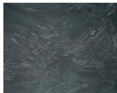
Decostotne beton šedá 1 s Mineral efektem Hematit a diamant-perlový

Následovně jsou zobrazeny některé možné povrchové designy. Případné barevné odchylky od původních barevných vzorků jsou způsobeny technologií tisku a neopravňují k pozdější reklamaci. Doporučujeme odebrat vzorky předem, protože vzhled velmi závisí na „rukopisu“ příslušného zpracovatele.