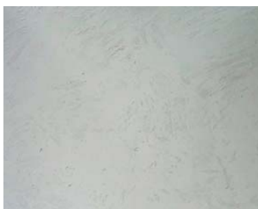
Decostotne bílá s Mineral efektem diamant-perlový