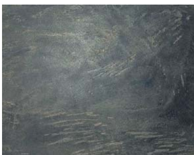
Decostotne beton šedá 1 s Mineral efektem Hematit a perletové zlato