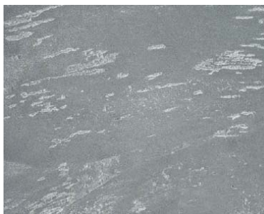
Decostotne beton šedá 1 s Mineral efektem diamant-perlový