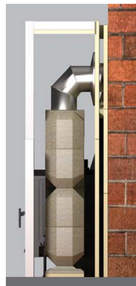
Řez trojvrstvou konstrukcí zadní stěny