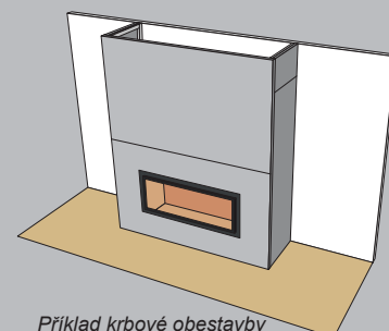
Příklad krbové obestavby celkově provedené z desek SKAMOTEC 225.