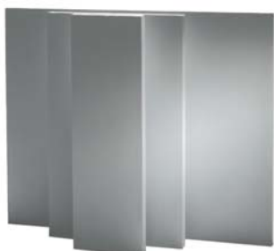
Konstrukční desky SKAMOTEC 225 lze snadno řezat do jakéhokoli tvaru nebo na jakoukoli velikost.

rozšiřování škodlivého kouře a při požáru neuvolňují žádné škodlivé látky. Tepelná odolnost a pevnost desek SKAMOTEC 225 také pomáhá zabránit vzniku prasklin a následným reklamacím nespokojených zákazníků.